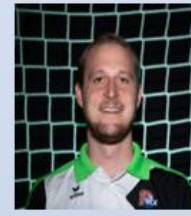
Logistik Silvan Käch