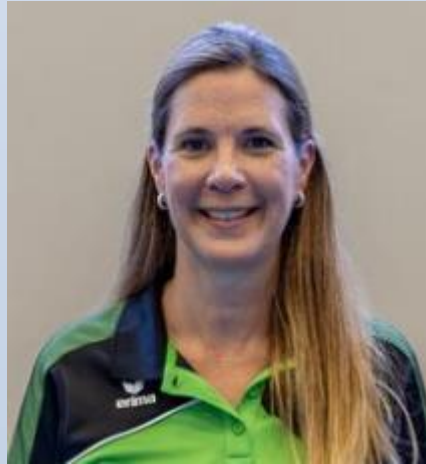
Carmen Flückiger Kommunikation/Sponsoring