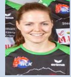
Komm & Sponsoring