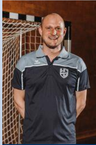
Logistik Silvan Käch