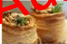
Für nicht Kutteln Liebhaber